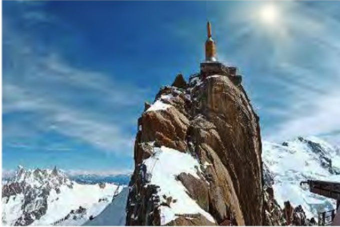
L'aiguille du Midi.

Quelle est l'altitude du sommet de l'aiguille du Midi ?