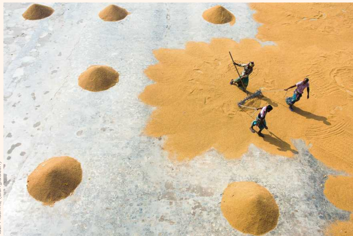
Kazi Mushfiq (Bangladesh)

Ces agriculteurs forment des tas de riz à l'aide d'un large râteau. Après avoir été ramassée dans la rizière, cette céréale a séché au soleil.